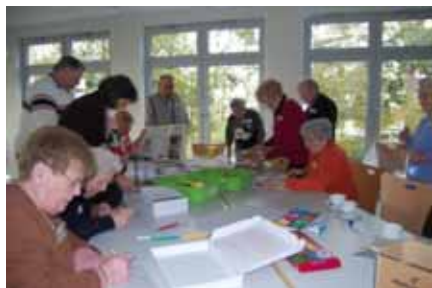
„Treppenhaus und Gartenzaun – Zwischen hinziehen und wegziehen“ 24.10.08

ressortübergreifenden „Lokalen Runden“ begleiten und unterstützen. Ergebnisse des Modellvorhabens, das vom Institut für Stadtteilentwicklung, Sozialraumorientierte Arbeit und Beratung (ISSAB) der Universität Duisburg-Essen wissenschaftlich begleitet wird, werden nach Ablauf der ersten Förderphase veröffentlicht. Informationen über Aktivitäten, Projekte und Zwischenergebnisse sind aber bereits jetzt über www.wohnquartier4.de abrufbar.