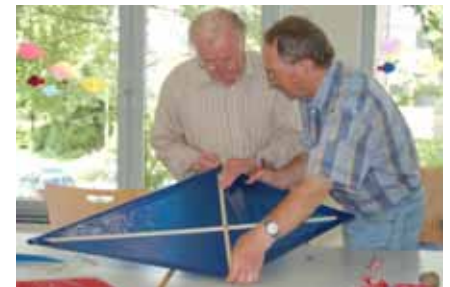
„Drachenbau mit Jung und Alt“ beim Kulturprogramm der Generationen 28.07.09

Die hier skizzierte idealtypische Organisations- und Steuerungsstruktur für die altersgerechte Quartiergestaltung ermöglicht eine systematische Verknüpfung der vier zentralen inhaltlichen Faktoren des Konzepts WohnQuartier 4 : Wohnen und Wohnumfeld, Gesundheit & Service und Pflege, Partizipation & Kommunikation sowie Bildung & Kunst und Kultur. Mit diesen vier Faktoren bietet das Konzept ein generelles Bezugssystem, um auf die Besonderheiten der jeweiligen Wohnquartiere „maßgeschneidert“ reagieren zu können. Denn auch wenn die Grundsätze des Handelns die gleichen bleiben, erfordern die jeweiligen sozialen und räumlichen Bedingungen in den einzelnen Wohnquartieren doch eine spezifische Konkretisierung dieser Grundsätze. So sind z.B. in einem Wohnquartier mit einem relativ hohen Bevölkerungsanteil an Migrantinnen und Migranten besondere Formen der Beteiligung zu entwickeln, die auch deren Organisationen und Vereine konsequent einbeziehen. Für die altersgerechte Quartiergestaltung im ländlichen Bereich wiederum wird es voraussichtlich notwendig sein, flexible und mobile Formen der Infrastrukturausstattung zu entwickeln.