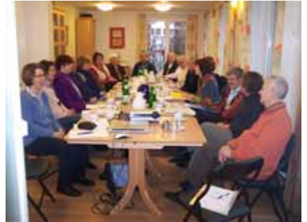
Zu den monatlichen Treffen erscheinen durchschnittlich 20 Teilnehmerinnen und Teilnehmer.

In ihrem gemeinsamen Leitbild verpflichten sich die Beteiligten auf gegenseitige Wertschätzung und Unterstützung, aktive Beteiligung und Verbindlichkeit in der Zusammenarbeit.