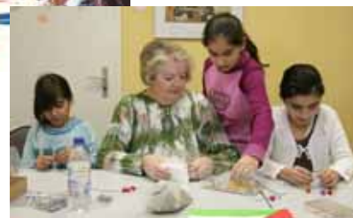
Basteln mit Kindern

nannten Netzwerkprojekte, bei denen die Bewohnerinnen und Bewohner an bestimmten Entwicklungs- und Entscheidungsprozessen teilhaben, sich Bürgerinnen und Bürger sowie Dienstleistungspartner aber auch qualifizieren und engagieren können. Bisherige Projekte waren unter anderem die „Qualifizierung und Beschäftigung im Dienstleistungsbereich Märkisches Viertel“ und die Eröffnung einer behindertengerechten Gäste- und Musterwohnung im Märkischen Viertel. Des Weiteren finden Diskussionsrunden und Fokusgruppen mit der Bewohnerschaft des Märkischen Viertels im Rahmen des Projekts „Bedarfsanalyse zur Dienstleistungsstruktur im Märkischen Viertel“ statt. Die Themen sind: „Wie möchten Sie im Alter wohnen?“, „Wie möchten Sie im Alter versorgt werden?“, „Wie möchten Sie Ihre Freizeit