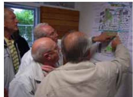
Ältere Bürger vor Plan, Waiblingen