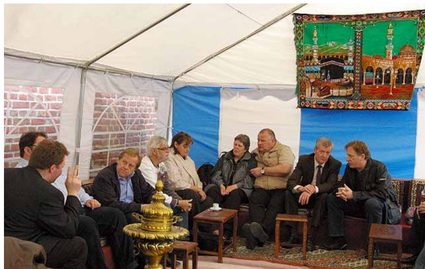
„Interkulturelle Begegnungen“

Multikulturelle Wohngruppen und letztlich auch die Errichtung von Altenpflegeheimen mit Abteilungen für Seniorinnen und Senioren ausländischer Herkunft mit muttersprachlichem Betreuungspersonal und Gebetsräumen sollten nach Bedarf mit den älteren Menschen geplant und umgesetzt werden. Dies kann besonders gut in den Stadtvierteln geschehen.