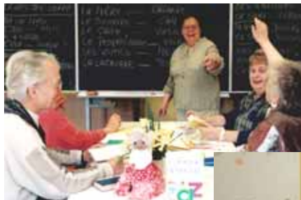
Französisch-Kurs im Ribbeckhaus

Zahlreiche Initiativen, die die Bewohner aktiv in den Ideenprozess einbeziehen, entwickeln neue Serviceangebote und passen diese an. So findet z.B. regelmäßig ein „Netzwerkfest“ statt, welches zum einen zur Verständigung der Generationen und Stärkung der Nachbarschaftsstruktur, zum anderen aber auch zur Förderung des direkten Dialogs mit Verantwortlichen des Netzwerks und Ansprechpersonen der Dienstleistungsanbieter dient. Einen großen Stellenwert haben die so-