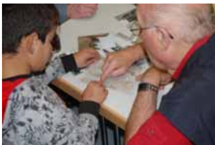
Intergenerativer Austausch beim ersten Nachbarschaftstreffen 11.09.08

teilmoderatorinnen/-moderatoren eingesetzt werden, die die lokalen Akteure an einen Tisch bringen und dabei unterstützen, die jeweiligen Bedarfe und Problemlagen zu erkennen und zu artikulieren – auch und gerade gegenüber den zuständigen Ressorts der Stadtverwaltung.